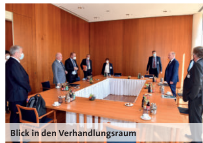
Blick in den Verhandlungsraum