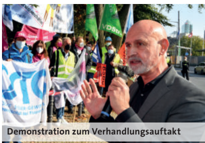
Demonstration zum Verhandlungsaufakt