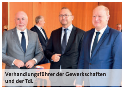
Verhandlungsführer der Gewerkschaften und der TdL